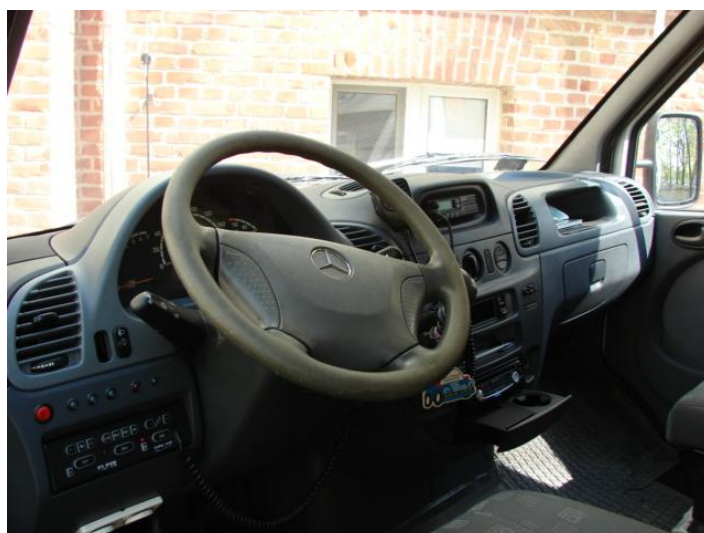
Wycena Mercedes Benz ZCH M489 021