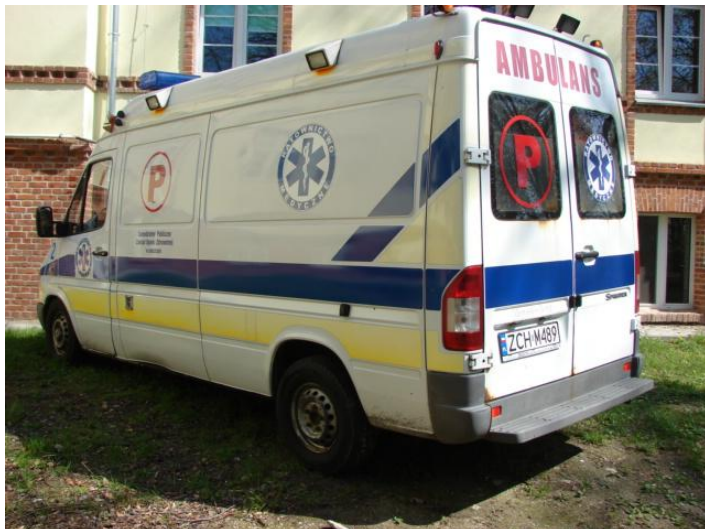
Wycena Mercedes Benz ZCH M489 015

Rodzaj pojazdu: Samochód ciężarowy specjalny do 3.5t*