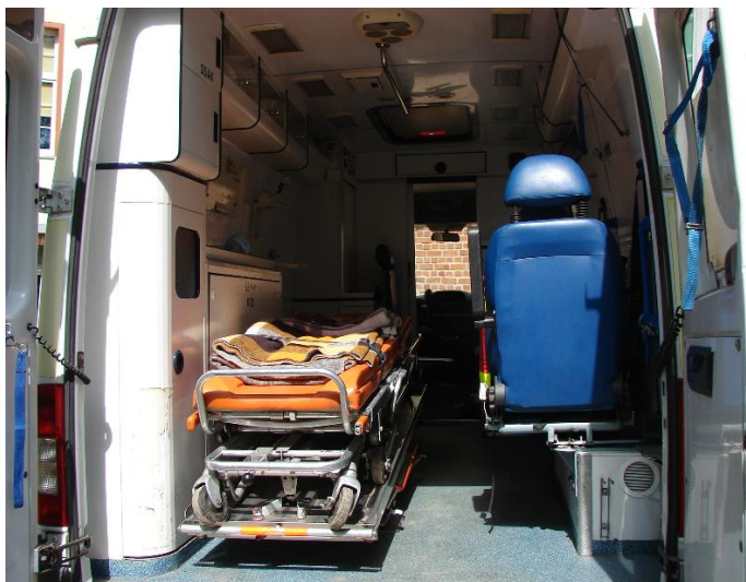
Zabudowa Mercedes -Benz ZCH M489 001