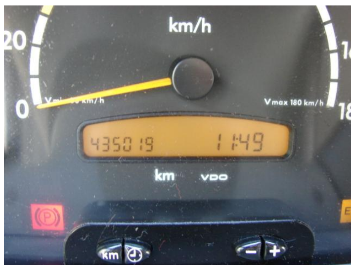
Wycena Mercedes Benz ZCH M489 025