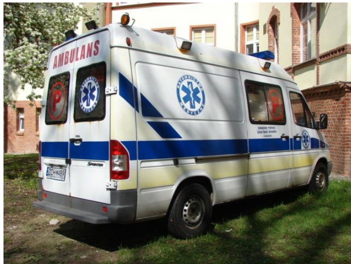
Wycena Mercedes Benz ZCH M489 017