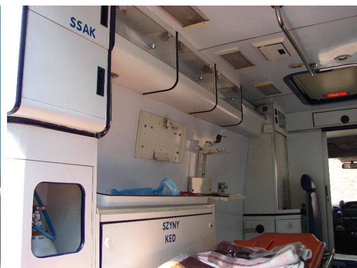
Zabudowa Mercedes -Benz ZCH M489 005