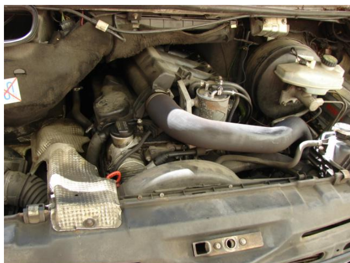
Wycena Mercedes Benz ZCH M489 028