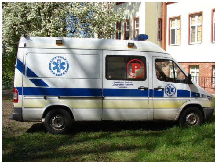
Wycena Mercedes Benz ZCH M489 018