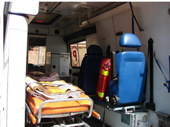
Zabudowa Mercedes -Benz ZCH M489 002