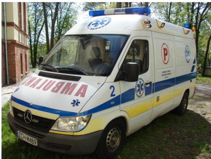
Wycena Mercedes Benz ZCH M489 019