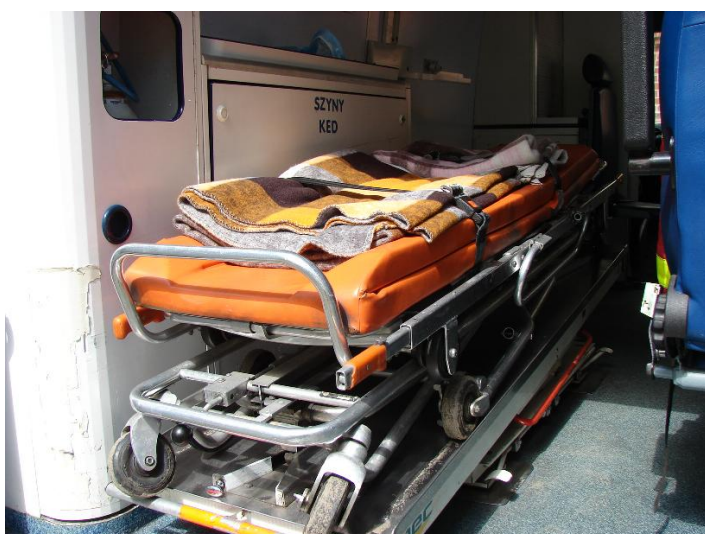
Zabudowa Mercedes -Benz ZCH M489 004