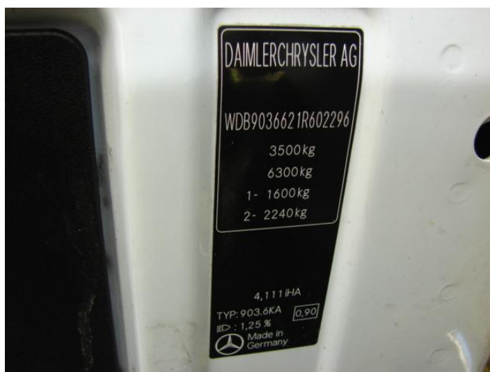
Wycena Mercedes Benz ZCH M489 023