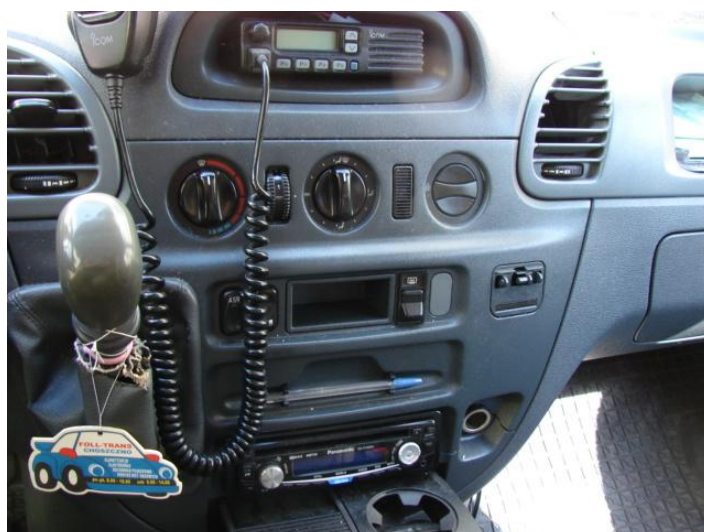
Wycena Mercedes Benz ZCH M489 026