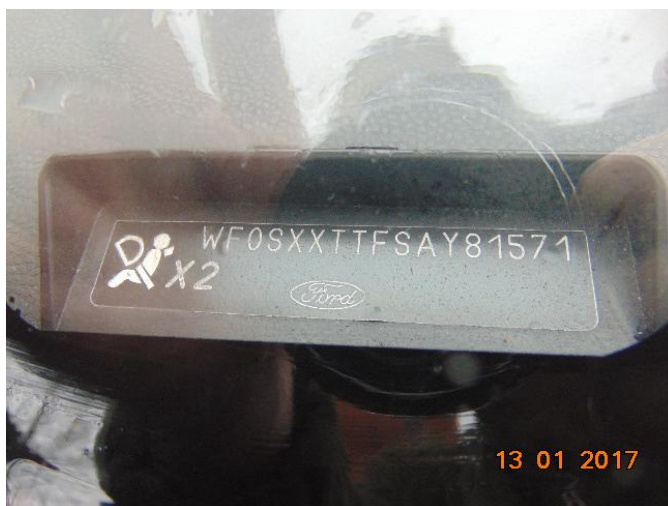
Wycena FORD ZCH 09700 019