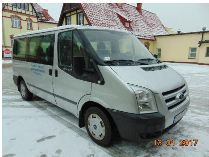
Wycena FORD ZCH 09700 005