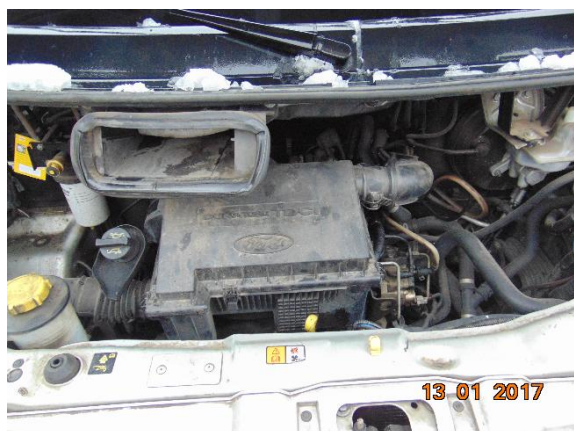
Wycena FORD ZCH 09700 017