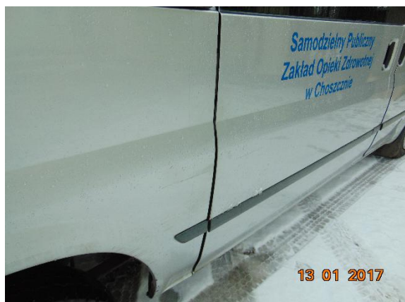
Wycena FORD ZCH 09700 004