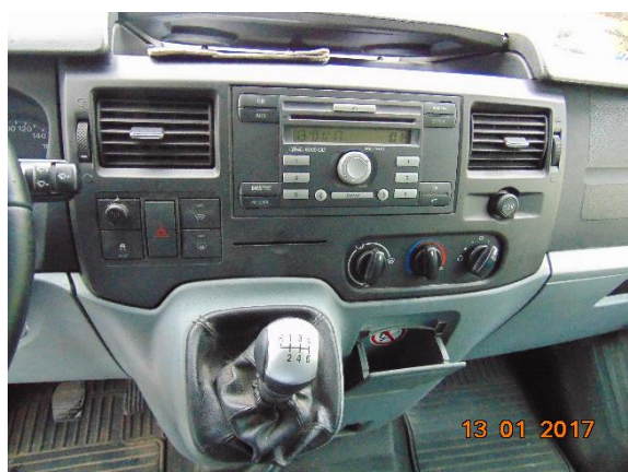
Wycena FORD ZCH 09700 011