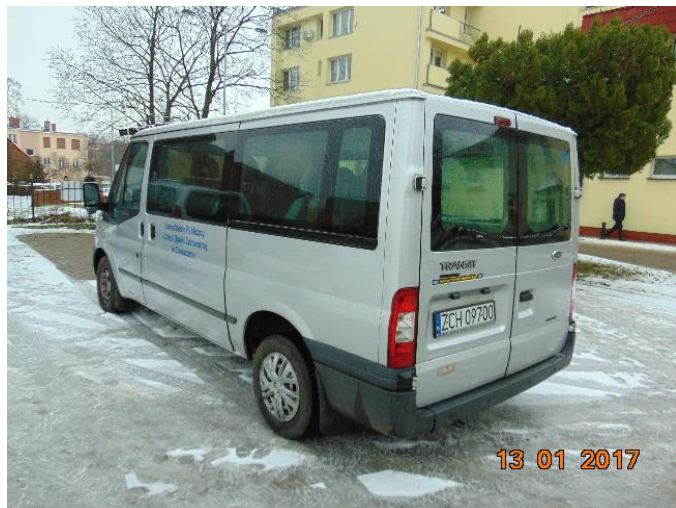
Wycena FORD ZCH 09700 001

Marka: FORD Model pojazdu: FT 280 2.2 TDCi Kat. MR`07 E4 2.8t Wersja: M Trend Nr rejestracyjny: ZCH09700 Rok prod.: 2010 Rodzaj pojazdu: Samochód osobowy do 3.5t*