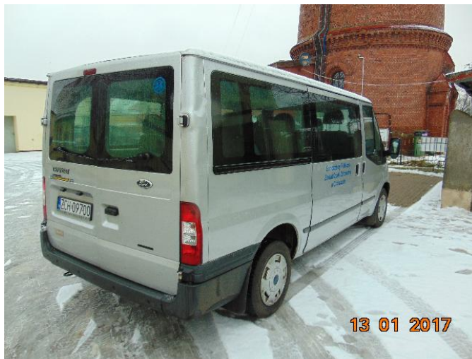
Wycena FORD ZCH 09700 002