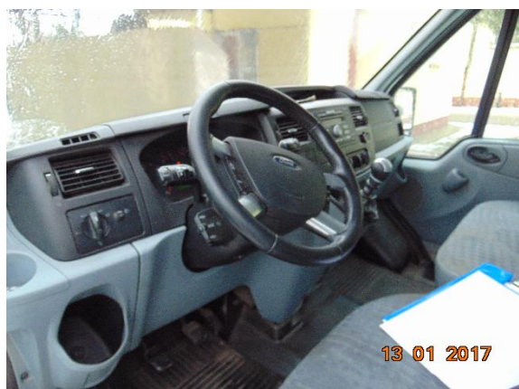
Wycena FORD ZCH 09700 008