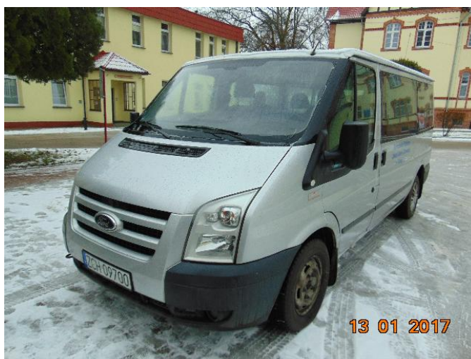
Wycena FORD ZCH 09700 007