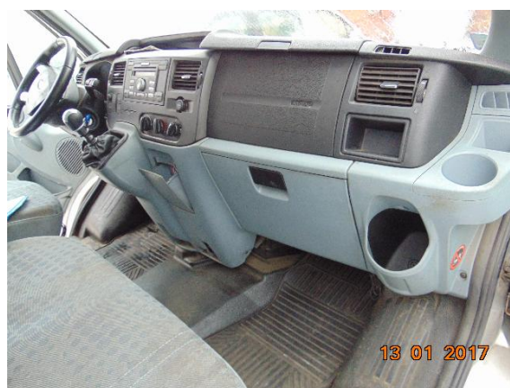
Wycena FORD ZCH 09700 013