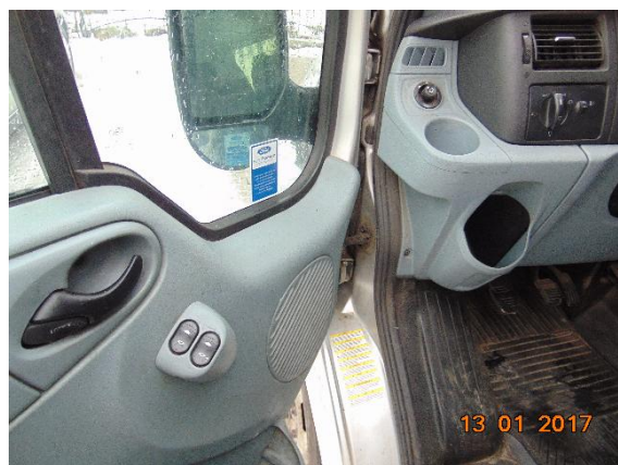
Wycena FORD ZCH 09700 009