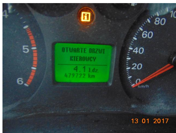
Wycena FORD ZCH 09700 010