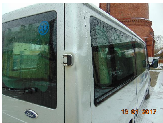
Wycena FORD ZCH 09700 003