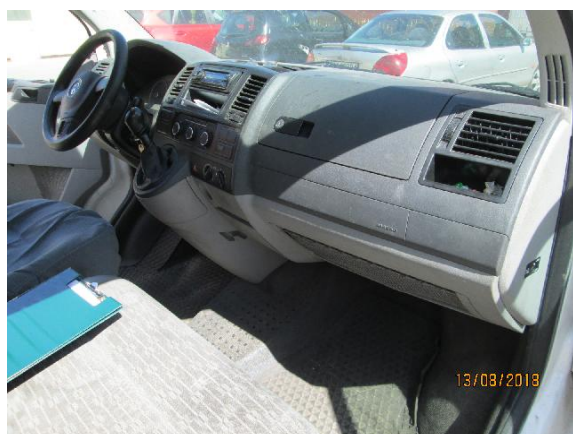
VW T5 ZCH 17242 009