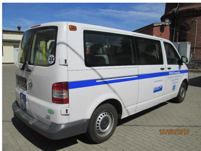
VW T5 ZCH 17242 005