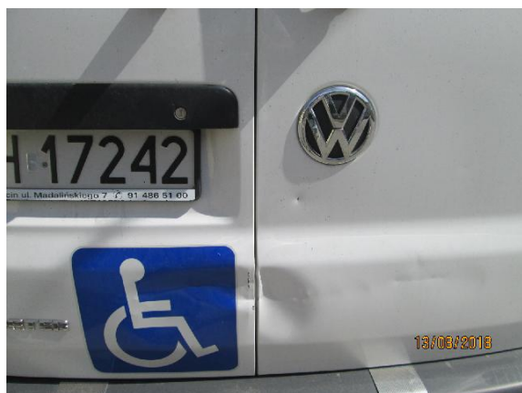
VW T5 ZCH 17242 021