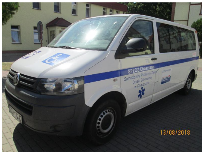
VW T5 ZCH 17242 002

Rodzaj pojazdu: Samochód ciarowy do 3.5t