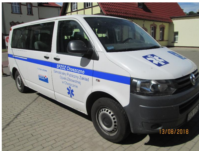
VW T5 ZCH 17242 003