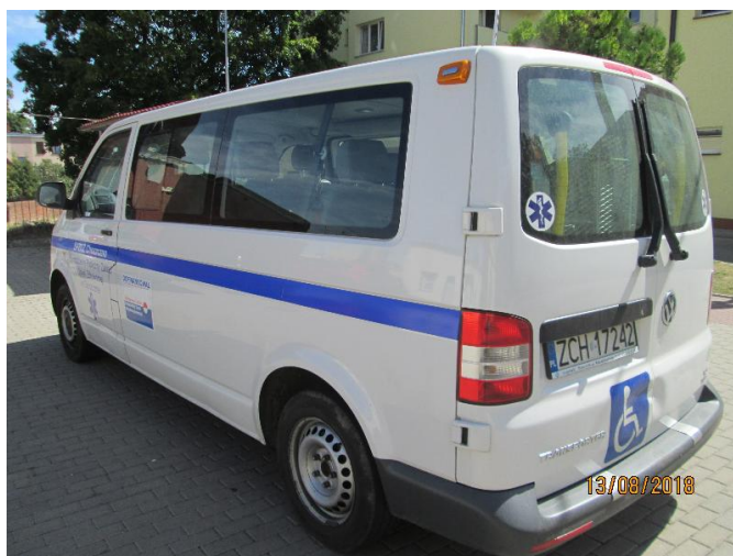
VW T5 ZCH 17242 006