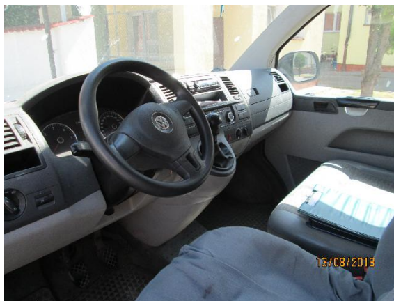
VW T5 ZCH 17242 008